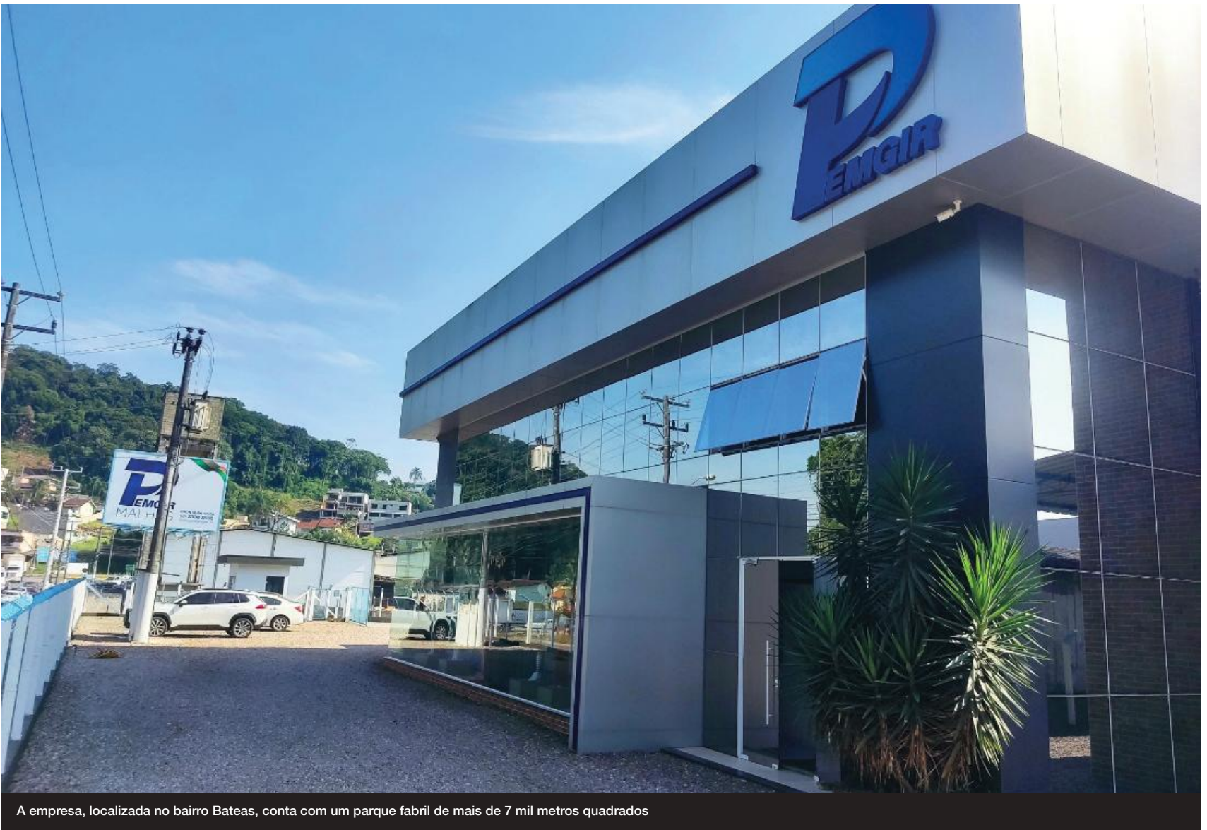
A empresa, localizada no bairro Bateas, conta com um parque fabril de mais de 7 mil metros quadrados