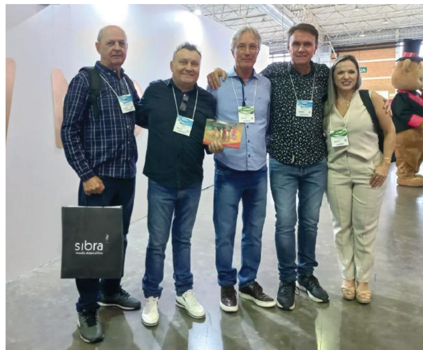
Os diretores também aproveitaram os contatos feitos no evento para fazer o convite a lojistas para participarem da 66ª Pronegocio

O evento é exclusivo para lojistas e fabricantes de confecção de Santa Catarina. Mais informações: https://ampebrusque.com.br/pronegocio/home .