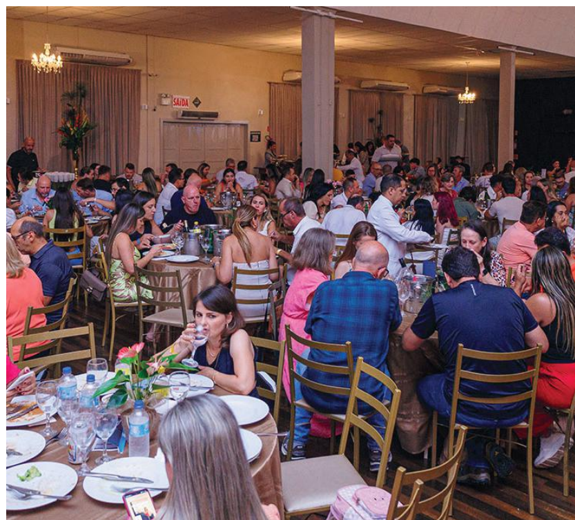
O evento foi prestigiado por mais de 500 pessoas, entre compradores, fabricantes, autoridades, imprensa e convidados