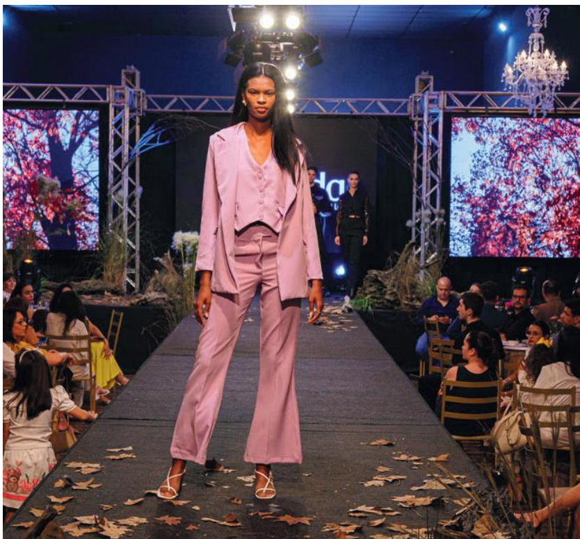
Com o tema Feel the Forest, o desfile teve como inspiração a transição da natureza entre o fim do outono e início do inverno

presas que participam do desfile, no dia seguinte na rodada”, frisa Schoening.